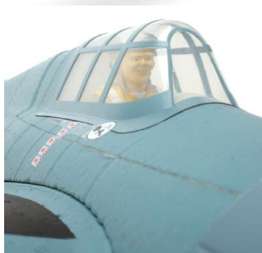
Rytí panelů, namalovaná hotová kabina a ručně nabarvený pilot