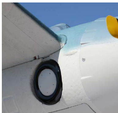
Maketové realistické barevné schéma, naznačený zatahovací podvozek