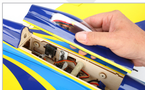
Rychlý přístup k elektro vybavení