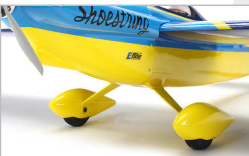
Zbarvení motorového krytu a krytů kol má stejný odstín jako potahová fólie