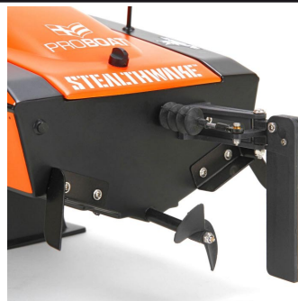
Loď má nainstalováno kormidlo a stabilizační plošky pro vynikající stabilitu a jízdní vlastnosti.