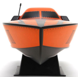
Výkonný závodní člun s charakteristickým profilem trupu Deep-V.