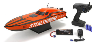
Sada obsahuje sestavenou loď, vysílač s bateriemi, stojánek na loď, pohonnou baterii a nabíječ.