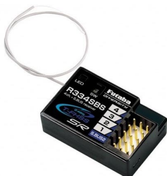
Přijímač 4k R334SBS 2.4GHz T-FHSS S.BUS2