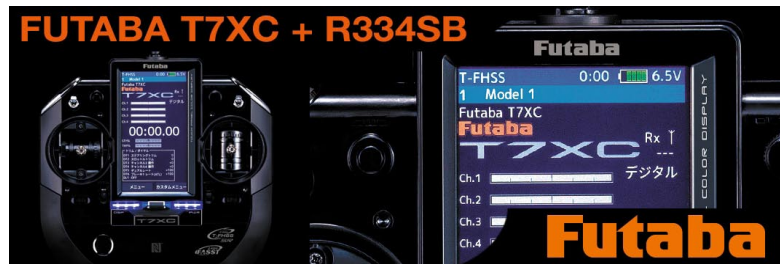
Velký 4,3" barevný dotykový LCD displej.