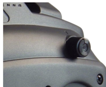
Otočný potenciometr 6. kanálu