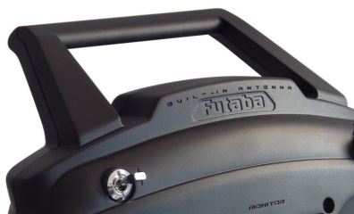
Anténa uvnitř skříně