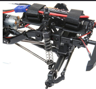
Náhon všech kol 4WD, nezávislé odpružení olejovými tlumiči s dlouhým zdvihem.