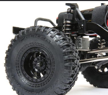
Speciální licencované pneumatiky Falken™ 1.55 s měkkou směsí pro maximální přilnavost.