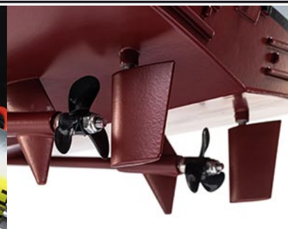
2 LODNÍ ŠROUBY

Regulátor Spektrum 40A 2-v-1 má konektor pro připojení osvětlení LED, což vám umožní ovládat světla lodi pomocí vysílače. Regulátor Spektrum 40A má účinný hliníkový chladič.