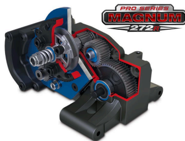
Převodovka Magnum 272R