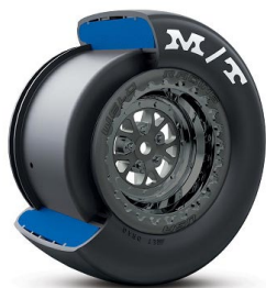
Kola a pneumatiky Dragster