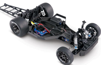
Nový podvozek s nízkým těžištěm

Karosérie Chevy C10 je v barvách červená, modrá, fialová, zelená, černá a bílá