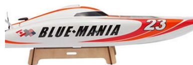
Laminátový trup lodi má hotové zbarvení.