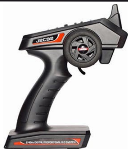
Vysílač v pásmu 2,4 GHz. Integrovaná anténa ve vysílači vylučuje její poškození během provozu.