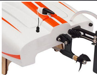
Sestavený pohon s lodním šroubem, ohebnou hřídelí a kormidly.