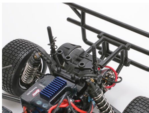
Nízký profil zadních věží tlumičů a rozměrný zadní nárazník

Délka: 394mm Šířka: 178mm Rozvor: 203.2mm Hmotnost: 708g Motor: RX 280