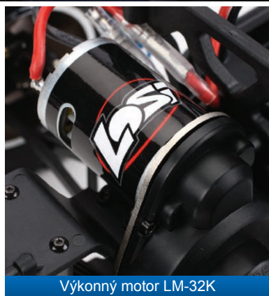
Výkonný motor LM-32K