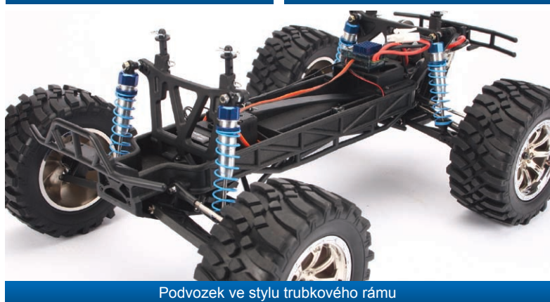
Podvozek ve stylu trubkového rámu