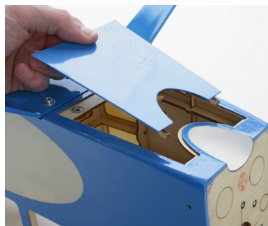
Dobře přístupný kryt baterií