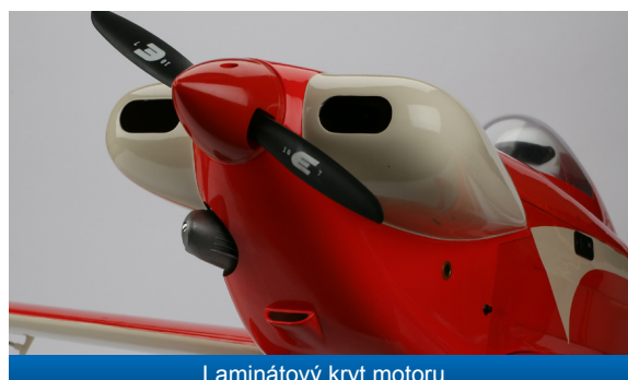
Laminátový kryt motoru