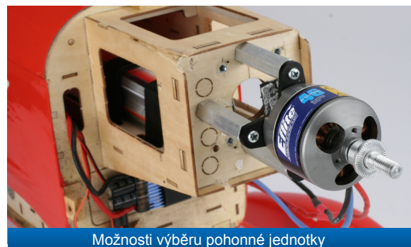
Možnosti výběru pohonné jednotky