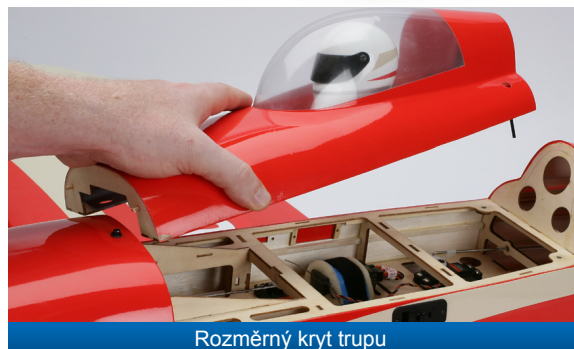
Rozměrný kryt trupu