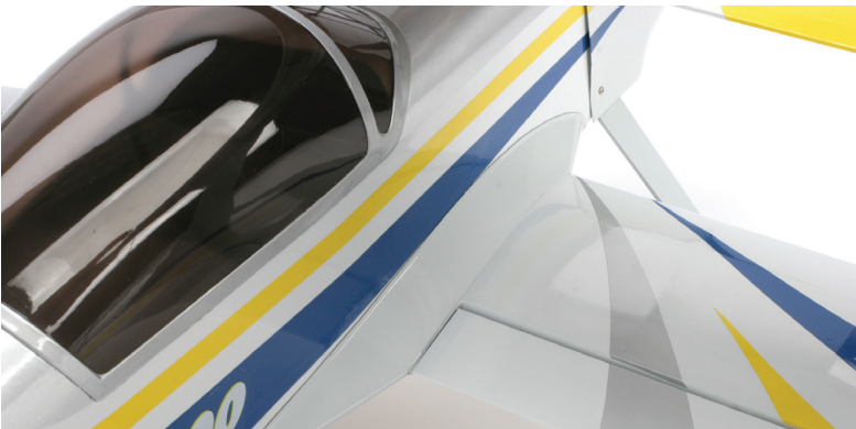
Atraktivní potah fólií Ultracote