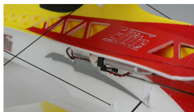
Lehká konstrukce vyztužená uhlíkem