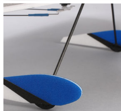
Uhlíkový podvozek s kryty kol

Rozpětí: 823 mm Délka: 940 mm Plocha křídla: 25,5 dm 2 Hmotnost : 179-184 g s baterií Motor: E-flite Park 250 BL, 2200Kv Vrtule: 8x4 Regulátor: E-flite 10 A střídavý Doporučená bat.: LiPol 7,4V 430mAh Použití: Indoor F3P/Aerobatic Flyer Doba sestavení: 4-5 hodin