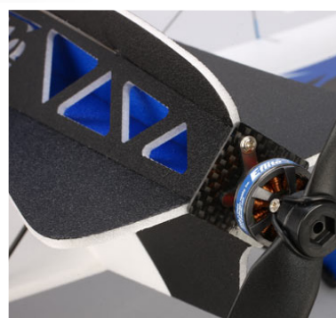
Uhlíkové motorové lože