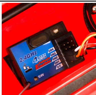
Kompletně sestaven s nainstalovanou 2 kanálovou RC soupravou 2,4GHz a 2 kanálovým vodě odolným přijímačem.