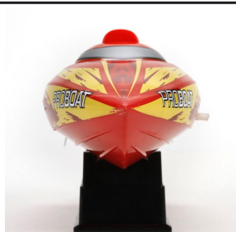
Výkonný závodní člun s charakteristickým profilem trupu Deep-V.