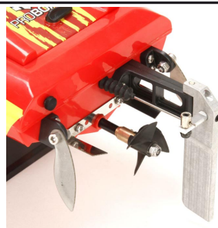
Lod' má nainstalováno Offset kormidlo pro vynikající stabilitu a jízdní vlastnosti.