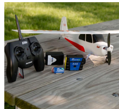
V sadě je obsažen model, vysílač, nabíječ, zdroj, baterie vysílače a napájecí LiPol baterie.