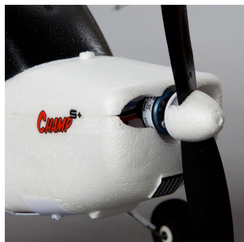
K pohonu je použit střídavý výkonný motor 180BL 2500Kv s 2-listou vrtulí 5x2,75.