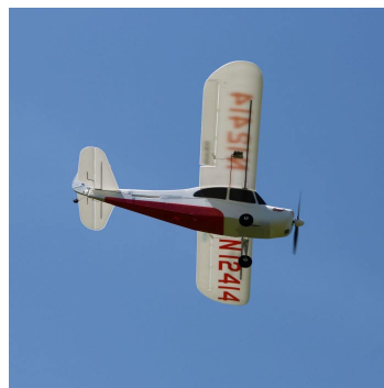
Model Champ S+ má řízeny základní funkce, jako plyn, směrovku, výškovku a křídélka.