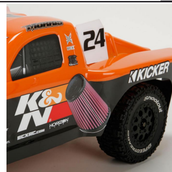
Torment má hotovou karosérii v barvách společnosti K&N.