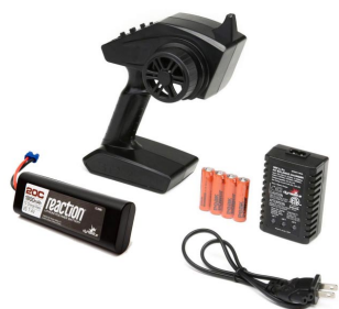
Vysílač Spektrum STX2 2CH 2.4GHz FHSS, LiPol Dynamite 7.4V 1800mAh 2S a nabíječ Dynamite 10W LiPol AC.