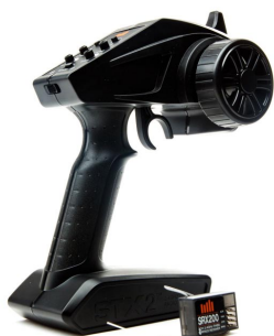
2-kanálová volantová RC souprava Spektrum STX200 2,4 GHz FHSS má integrovanou anténu a jednoduché a rychlé nastavení.