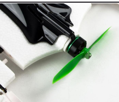
Model pohání střídavý motor Thrust™ 2205-2350Kv s 2-listou vrtulí 5x4.