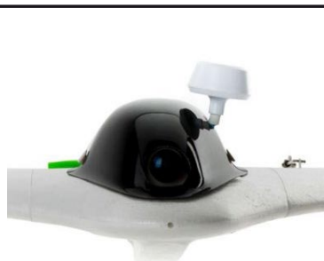
Verze BLH3050 má nainstalovanou kameru, video vysílač s anténou.