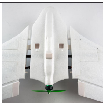
Výhodou je možnost rozebrat model na 3 díly, díky tomu jej lze snadno přepravovat.